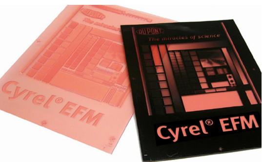
DuPont™ Cyrel® EASY FAST EFM

La plaque numérique à points plats permettant un excellent transfert d'encre