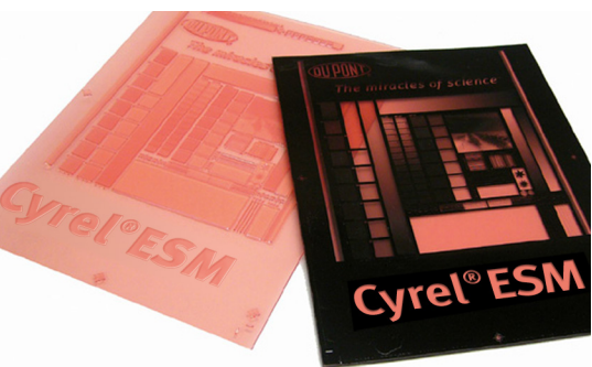
DuPont™ Cyrel® EASY ESM

La plaque numérique à points plats permettant un excellent transfert d'encre