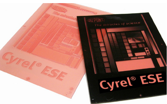
DuPont™ Cyrel® EASY ESE

La plaque numérique à surface microstructurée qui génère des points plats