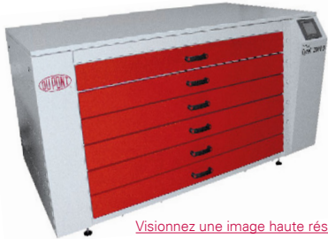
Visionnez une image haute résolution