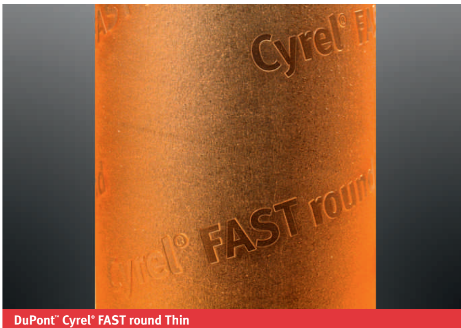
DuPont™ Cyrel® FAST round Thin