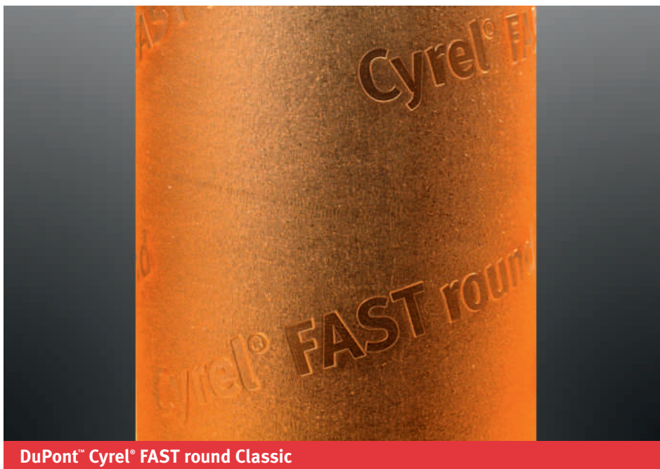
DuPont™ Cyrel® FAST round Classic