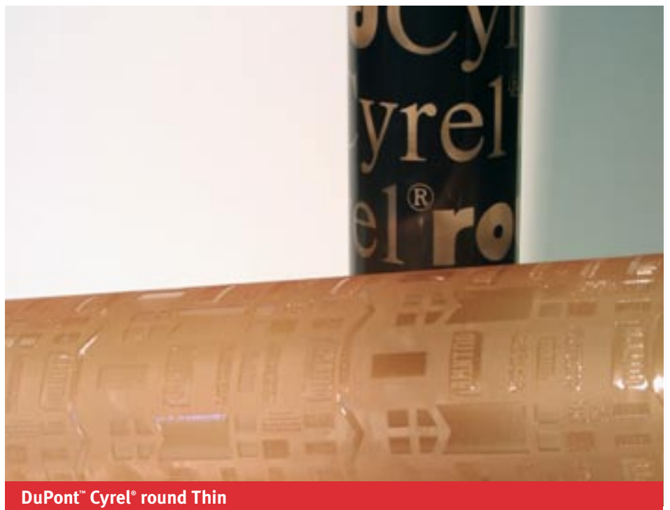
DuPont™ Cyrel® round Thin