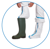
Également disponible avec chaussettes**