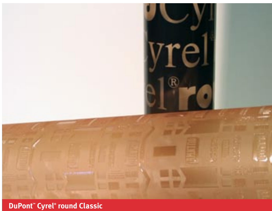
DuPont™ Cyrel® round Classic